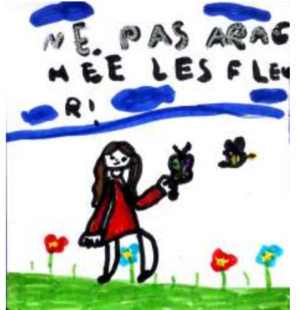
ماؤنا، 8 سنوات

انا رسمت فتاة مع بالونة لأنه جميل جدا المنظر لكل من يشاهده