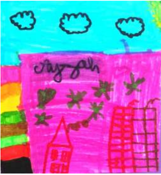
ايزاه، 8 سنوات رسمت بنايات لأسكن بداخلها