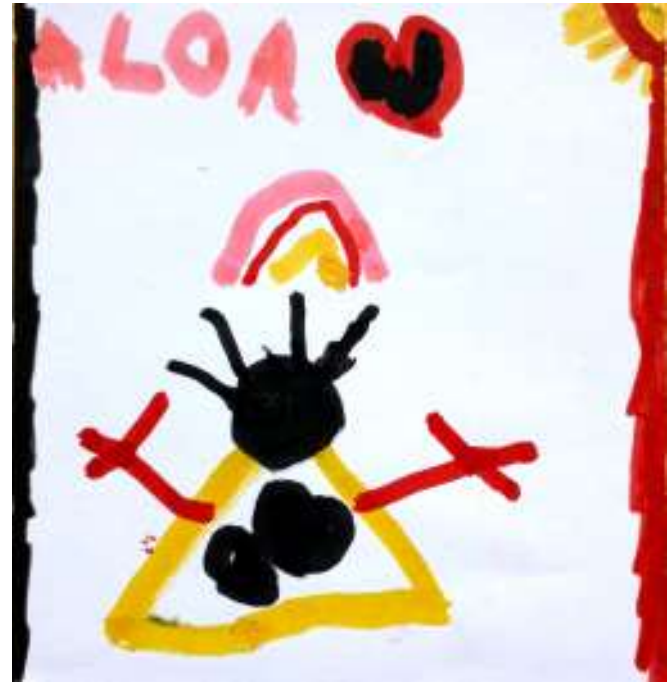
هابي، 6 سنوات

رسمت قوس قزح وشمس وفتاة وقلوب لانى احب الرسم وكذلك احب القلوب