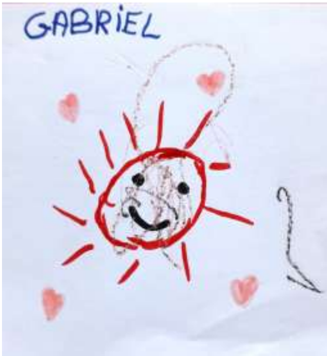
جابريل، 4 سنوات