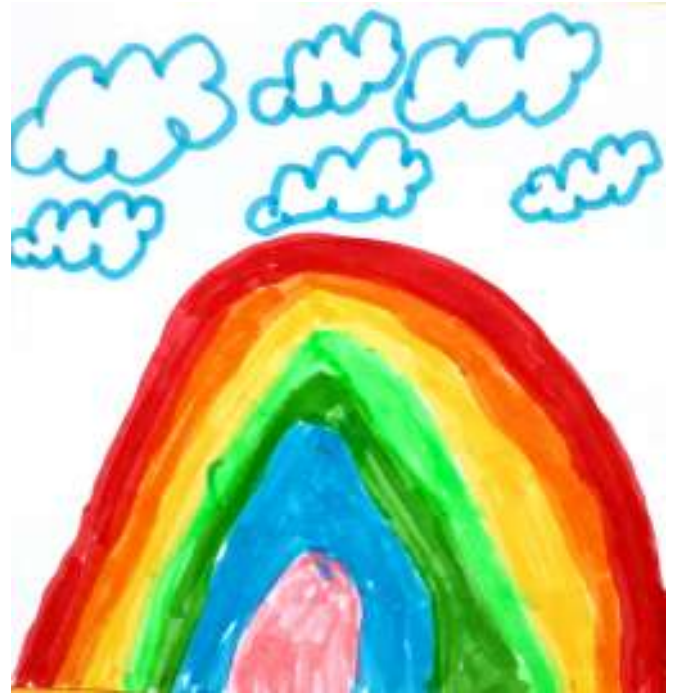
كينزا، 7 سنوات