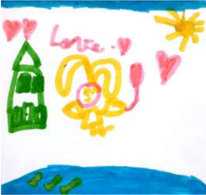
امنه، 7 سنوات

انا رسمت فتاة مع بالونة لأنه جميل جدا المنظر لكل من يشاهده