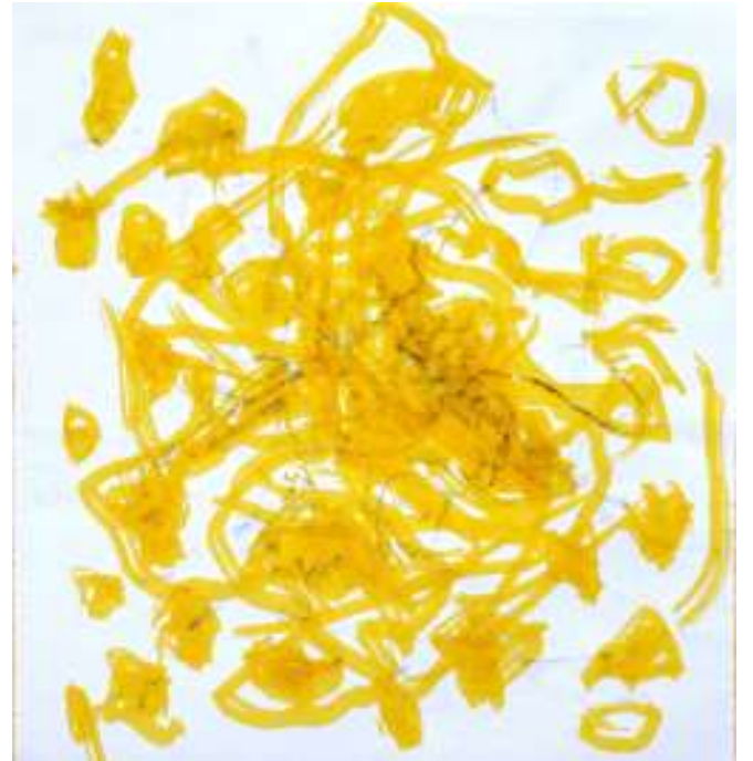
جيل، 3 سنوات