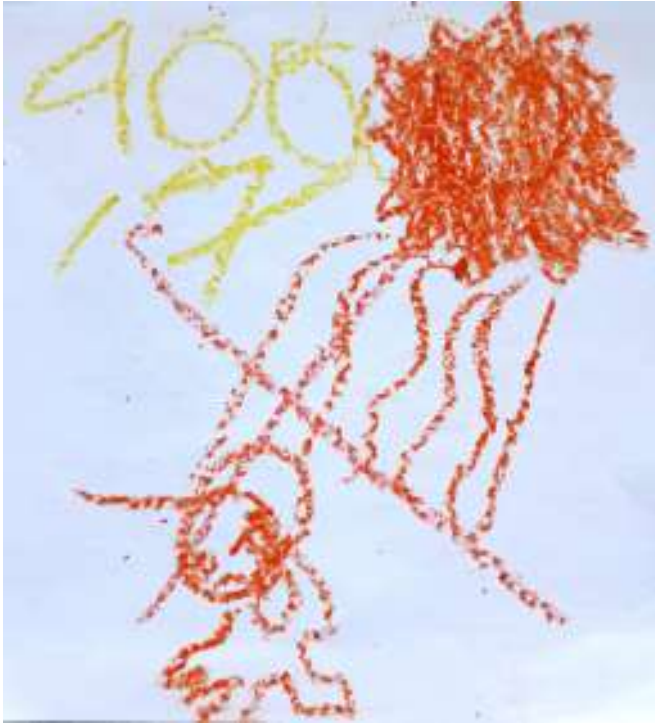
جوناثان، 9 سنوات

لقد رسمت الموجه الحرارية لان رأسي يؤلمني وقد رأيت شخصا قد حقق التحدي بوادي الأموات