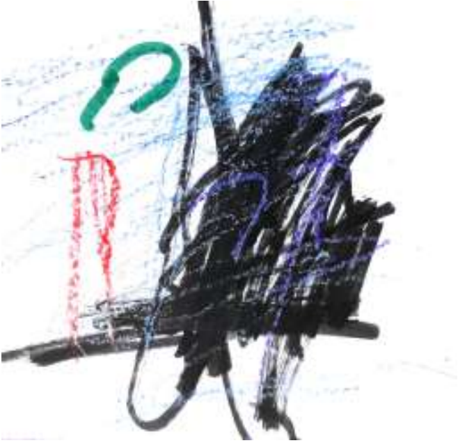
اميليا، 5 سنوات